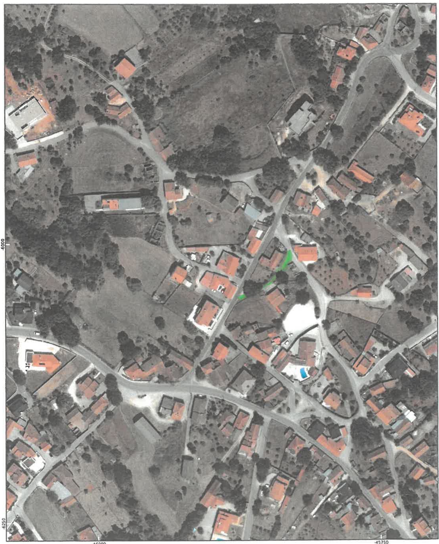
Planta produzida pelo utilizador a partir de um portal geográfico do município, servindo apenas de referência.