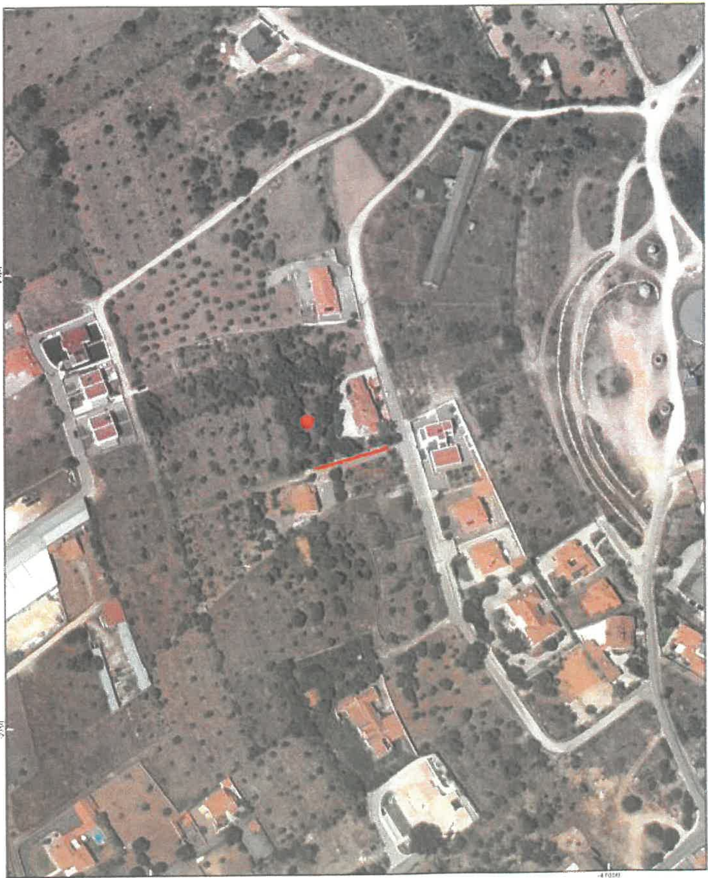
Planta produzida pelo utilizador a partir de um portal geográfico do município, servindo apenas de referência.

Praça D. Martim, nº 1 2690-494 Ourém Tel: 249 340 900 fax: 249 340 908 e-mail: geral@cm-ourém.pt